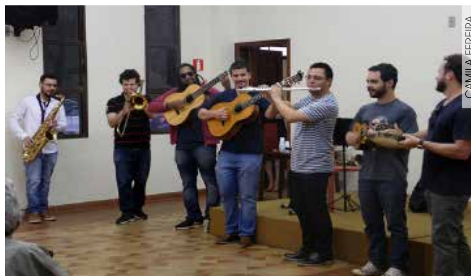
Grupo entrou pela lateral do auditório surpreendendo os moradores