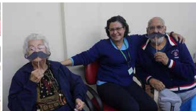
Família Pio participando das brincadeiras para posar para foto na festa de dia dos Pais