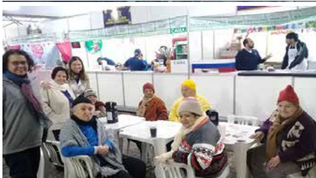
Registro do passeio à barraca do Residencial Casa do Sol na Festa Inverno 2018