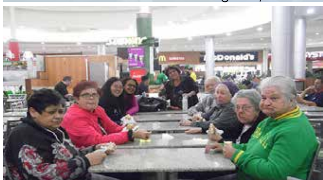
Registro da tarde de lanche e passeio no Litoral Plaza Shopping, em Praia Grande/SP