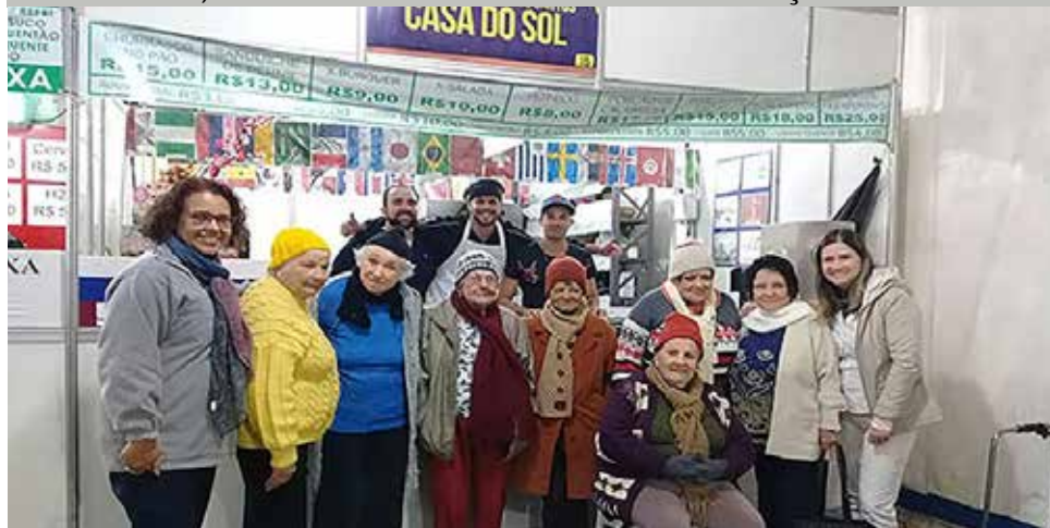
Grupo de moradores e equipe do Residencial na Festa Inverno

Por mais um ano o Residencial Casa do Sol teve a oportunidade de participar da Festa Inverno Santos, e para personalizar a barraca da Casa a equipe organizou o espaço e escolheram o tema "Rússia", país que sediou a copa do mundo em 2018, como decoração. Havia cortinas de bandeiras de todos os países participantes, bonecas russas, paisagens local, flores e bastante animação.