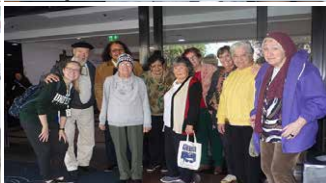
Passeio no Shopping Praiamar para prestigiar homenagens feitas ao dia do Voluntariado