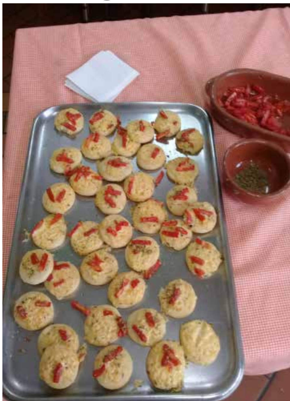
Mini discos de pizza de mussarela feitos pelos moradores da Casa

Como de costume, a equipe de nutrição realiza a oficina culinária com os moradores da Casa do Sol, a novidade é que neste último bimestre (julho/agosto) eles ousaram com receitas estrangeiras e utilizaram da gastronomia para comemorar uma data em especial.