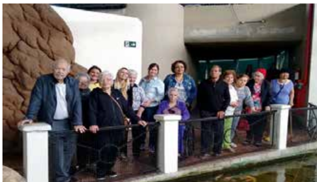
Moradores e funcionários posam juntos para a foto no Acaqua Mundo, aquário em Guarujá