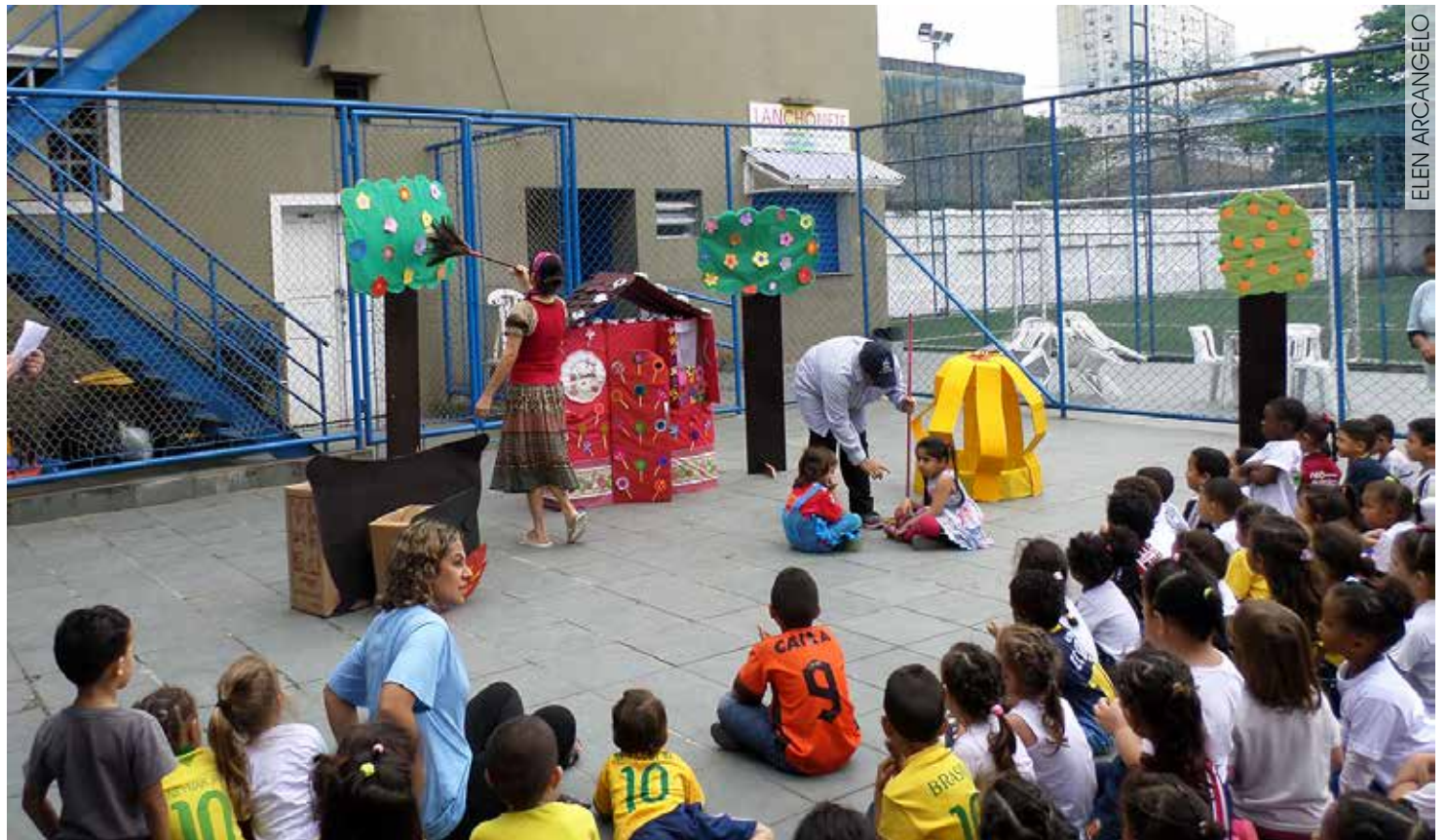
Apresentação teatral realizada em homenagem a Semana da Criança do Educandário Anália Franco

Nosso agradecimento e nossas preces em favor de todos que doaram com alegria.