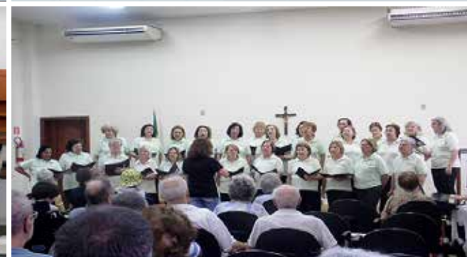
Apresentação do coral da FSS durante a Semana do Idoso do Residencial Casa do Sol