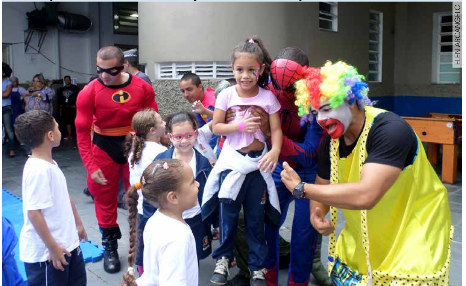
Alunos do Educandário Anália Franco se divertindo com os super-heróis durante a Semana da Criança