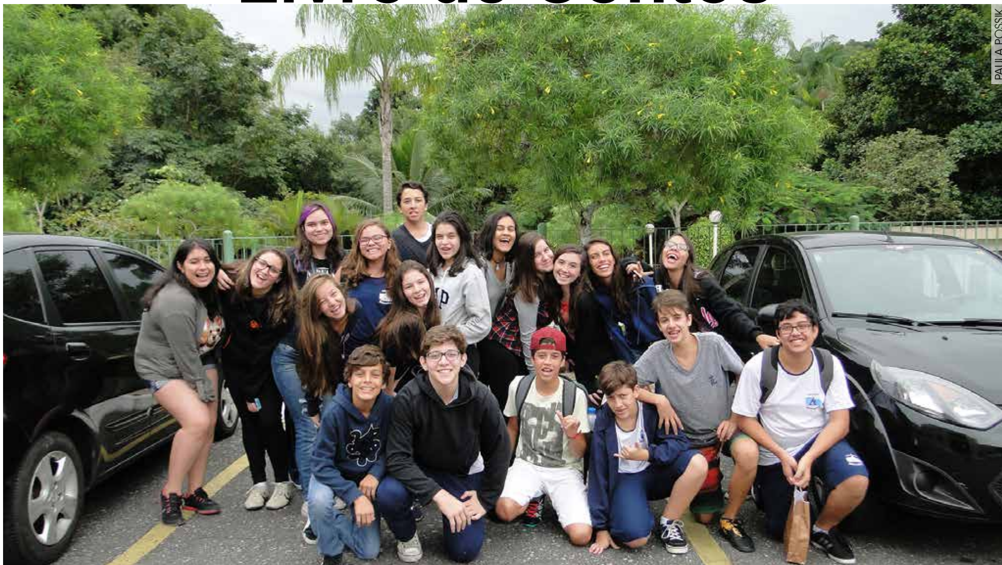
Foto tirada no Residencial Casa do Sol com os autores dos contos, os alunos do colégio Interativo, e que também foi ilustrada no próprio livro

E m homenagem aos moradores do Residencial Casa do Sol, os 23 alunos da turma do 9º ano do colégio Interativo elaboraram um livro de contos.