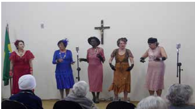
Apresentação do grupo Cantores do Rádio na Semana do Idoso do Residencial Casa do Sol