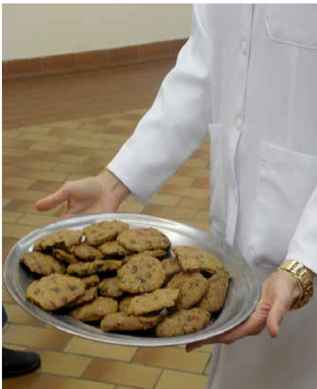
Cookies de gotas de chocolate preparado na Oficina Culinária Especial da Semana do Idoso