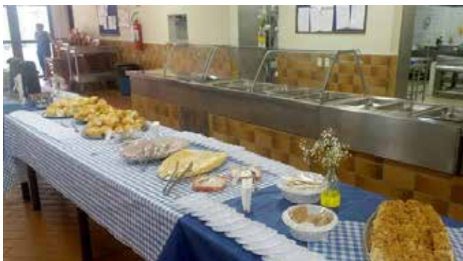
Café da manhã especial preparado durante Semana do Idoso do Residencial Casa do Sol